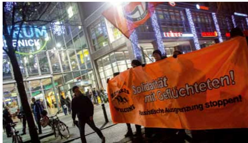
Solidarität mit Geflüchteten: Ende dieses Jahres protestierte UFFMUCKEN in Köpenick mehrfach gegen Rassismus.

Seit 2013 engagiert sich UFFMUCKEN auch verstärkt gegen Rassismus im Zusammenhang mit der Eröffnung von Sammelunterkünften für Geflüchtete im Bezirk Treptow-Köpenick. Es geht uns darum, eine solidarische Willkommenskultur zu etablieren, wenn Menschen vor Not und Vertreibung fliehen. Rassistischer Ausgrenzung und menschenverachtender Hetze setzen wir Akzeptanz und ein respektvolles Miteinander entgegen. Dafür engagieren wir uns beim Aufbau von Deutschkursen für Geflüchtete, gemeinsamen