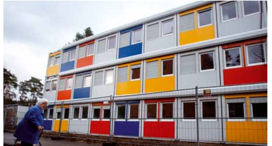
Die neue Container-Unterkunft in der Alfred-Randt-Straße im Allendeviertel.

Gesetzesverstöße haben vorrangig wirtschaftliche und soziale Gründe. Geburtsort oder Herkunft spielen dabei keine Rolle. Die Schlussfolgerung, Menschen ohne deutsche Staatsbürgerschaft seien krimineller als Deutsche, ist falsch. Verstöße gegen das rassistische Ausländer- und Asylrecht machen den größten Teil der Ermittlungsverfahren gegen „Nicht-deutsche“ aus. Deutsche können diese